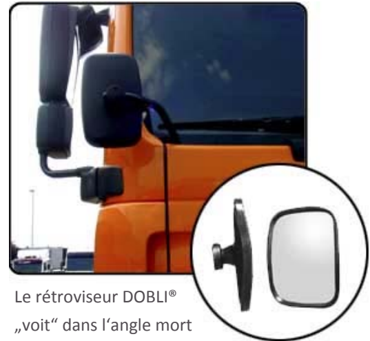
Le rétroviseur DOBLI® „voit“ dans l'angle mort

Certitude pour le conducteur - Sécurité pour les autres!