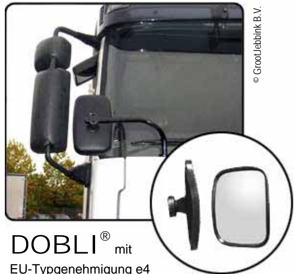
DOBLI ® mit EU-Typgenehmigung e4

Gewissheit für den Fahrer - Sicherheit für alle anderen!